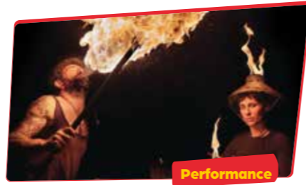
CIA. CIRKULEZ Pyromad

Un espectacle explosiu de pirotècnia a càrrec de dos piròmans francesos que debaten si el seu desig per cremar coses té a veure amb la gestió de les emocions o amb el simple plaer pel foc.