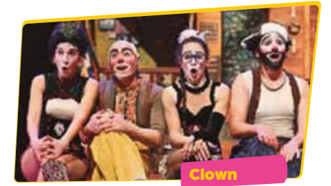
LA TROUPE MALABÓ Karpaty

Molt més que una txaranga, molt més que una batucada. Porten el ritme a la sang... i l'omplen de llum. Fan ballar tothom sorprenent a tots els sentits, també a la vista.