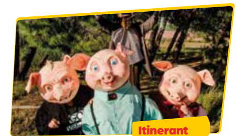
CIA. CAMPI QUI PUGI Pigs

Tot està preparat perquè el circ més petit del món, protagonitzat per polls, presenti el seu espectacle, o no? Potser primer han d'aconseguir l'ajuda del públic per aconseguir-ho.