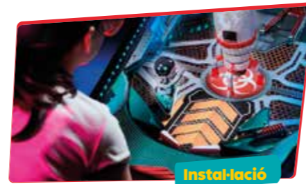
CIA. HOLOQUÉ SteamPinballs

L'electricitat i la connexió entre dues persones els portarà a descobrir nous mons que compartiran amb un públic que també connectarà amb la cultura, la música i el circ.