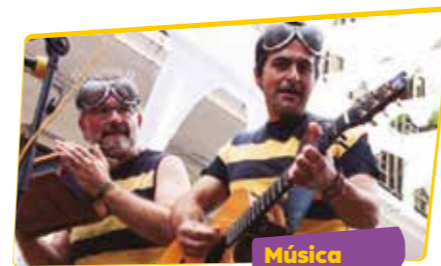
CIA. LA TRESCA I LA VERDESCA Zum

Un divertit viatge a l'època dels pioners de l'aviació, a principis del segle XX, que estan disposats a qualsevol cosa per demostrar com el seu somni pot enlairar-se.