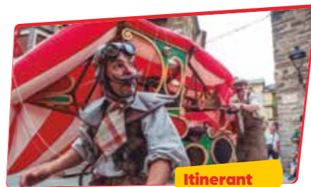
CIA. LA BALDUFA Zeppelin

En una pista de circ com les de fa més d'un segle a l'aire lliure, uns artistes ensenyen a sortir de la zona de confort, que moltes vegades pot ser més incòmoda que el que hi ha a fora.