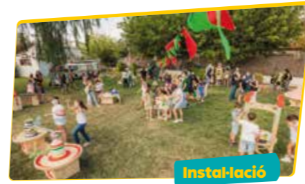
TOMBS CREATIUS Puck i la seva troupe

Un espectacle explosiu de pirotècnia a càrrec de dos piròmans francesos que debaten si el seu desig per cremar coses té a veure amb la gestió de les emocions o amb el simple plaer pel foc.