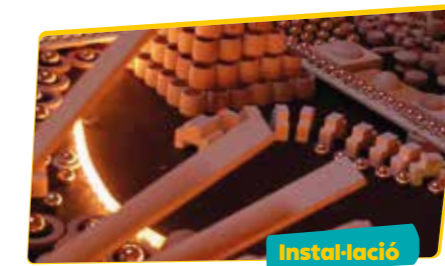
LA CITTÀ INFINITA La città infinita

El futur es retroba amb el passat a través d'uns cascos de realitat augmentada que et faran viure una experiència interactiva participant en primera persona en un pinball gegant.