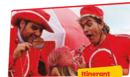
FADUNITO STREET ARTS Petit circ

El brunzit d'unes abelles ben especials promet posar tothom en moviment. I no per escapar d'elles, sinó per sumar-s'hi al seu espectacle musical participatiu. Serà com tenir ales!