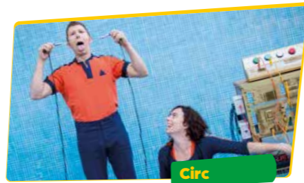
CIA. NOM PROVISIONAL Qui cu qui què quina

Uns artistes bojos d'amor pel circ i per la vida, que no els ha tractat bé. Fins que, quan ja creuen que no tenen res a fer, es troben davant del públic que sempre havien somiat.